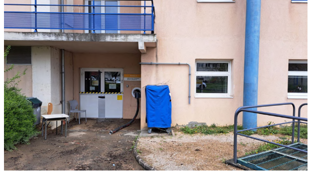
Situation au 03/04/2024