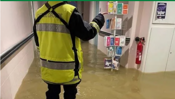
Situation pendant la crue