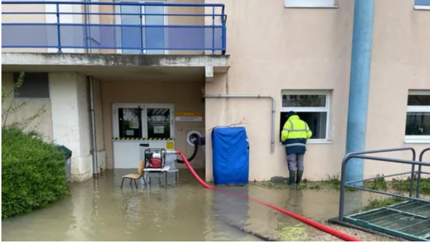
Situation pendant la crue