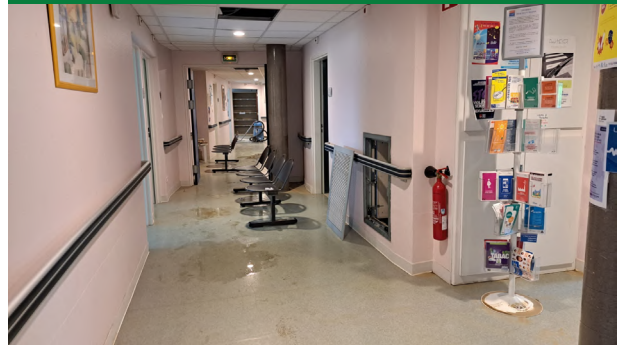
Situation au 03/04/2024