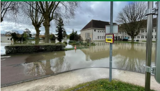
Situation pendant la crue