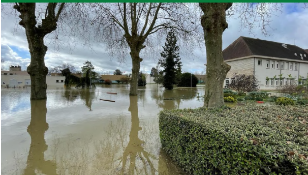
Situation pendant la crue

Avec la décrue confirmée et la levée de toutes les mesures de précaution, les efforts se concentrent désormais sur le nettoyage et l'évaluation minutieuse des dégâts et dommages causés par cet événement. Au regard de l'amélioration de la situation, les sorties et visites ont de nouveau été autorisées et le retour des patients en permission a pu être organisé. Le CH La Chartreuse tient à souligner la solidarité et l'entraide manifestées par l'ensemble des professionnels de l'établissement. Leur engagement a permis d'assurer la continuité et la sécurité des soins.