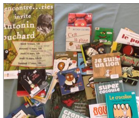
■ Antonin Louchard est l'invité de cette nouvelle édition.

Le dessinateur Antonin Louchard est l'invité de l'édition 2017 des Rencontre... ries du 14 au 17 mars. Celles-ci se dérouleront dans tout le département. L'objectif est simple : permettre à des enfants ou à des adolescents ainsi qu'à leurs parents de rencontrer des auteurs jeunesse.