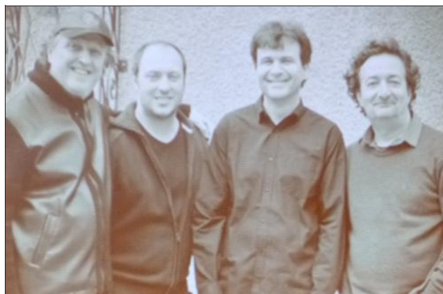
■ Le quatuor Jason Jazztet sera présent pendant ces trois jours MCC.

Les inscriptions aux master class big band et à la formation des arts du cirque sont à faire